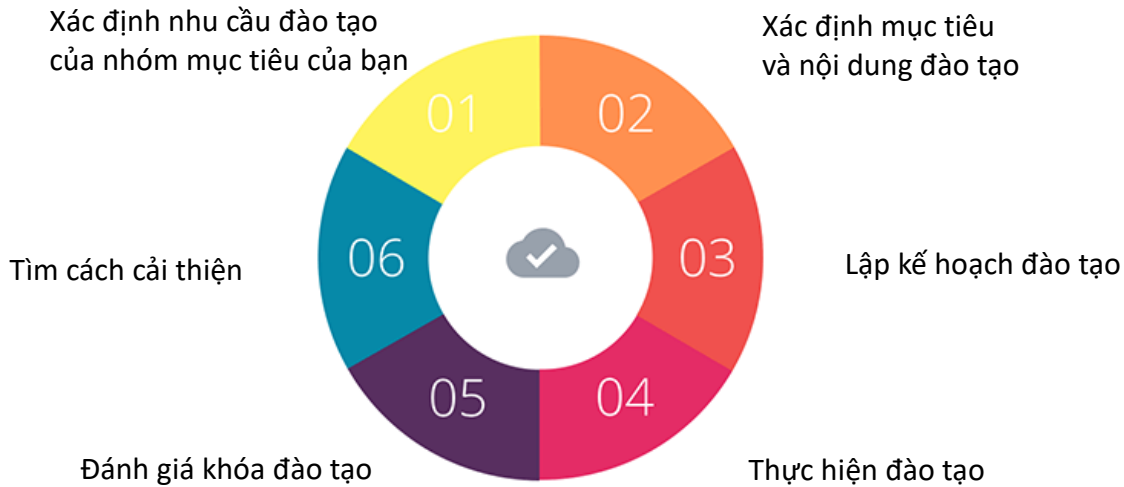
Hình: Sáu bước tổ chức đào tạo